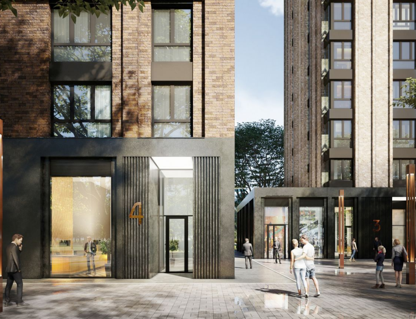
Жилой комплекс: Павелецкая Сити Год постройки: 2023 Тип дома: Монолитный