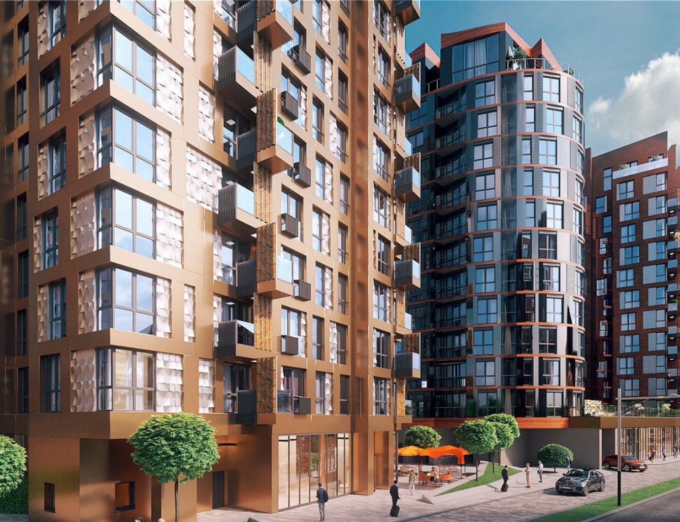
Жилой комплекс: Russian Design District Год постройки: 2023