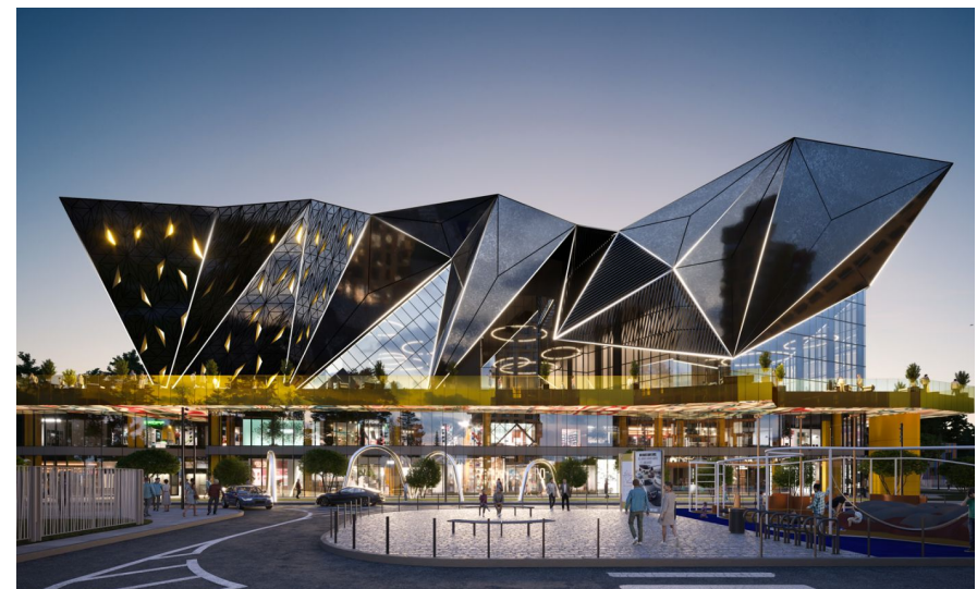
Корпус ЖК: Корпус 4а Квартал сдачи: 2