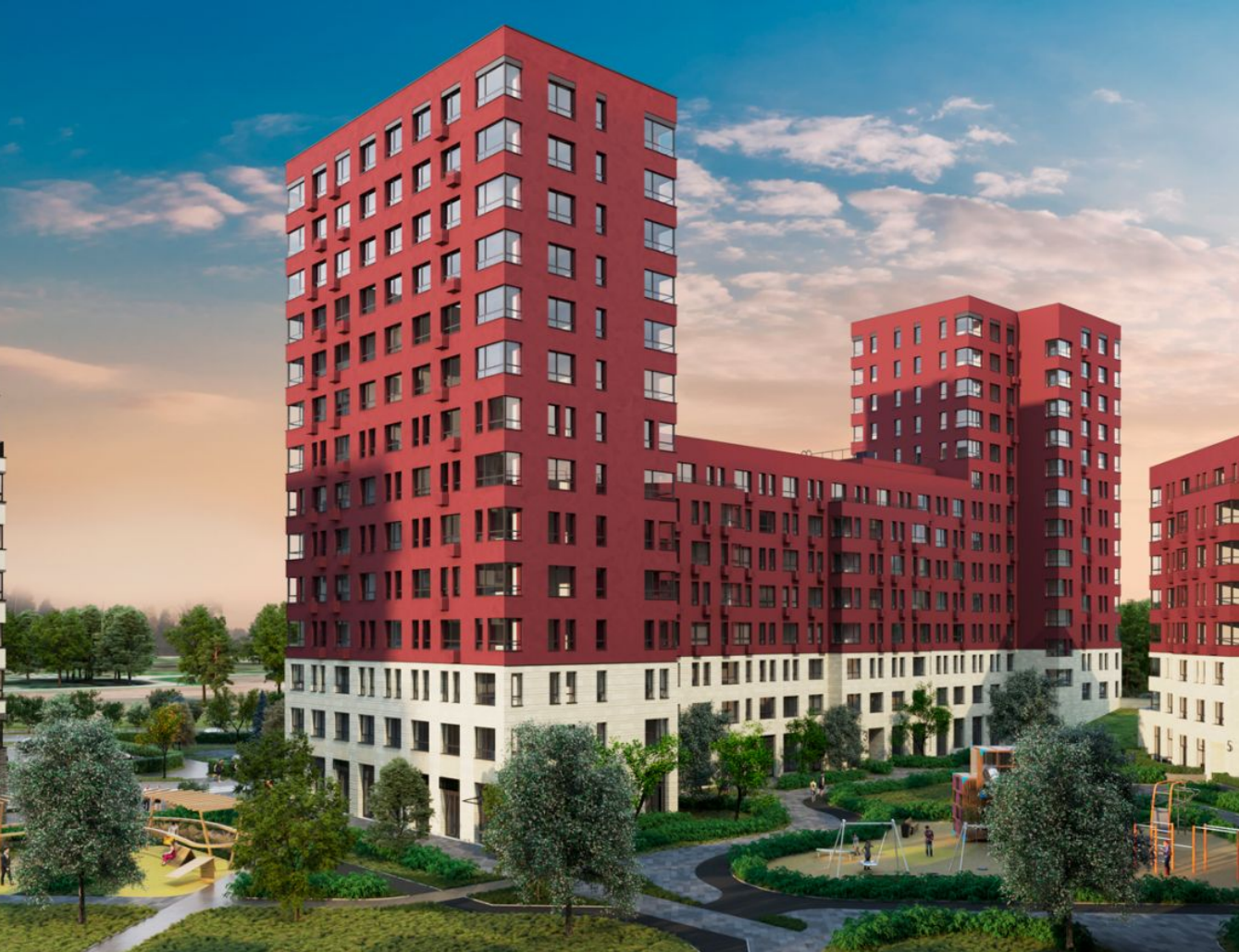
Жилой комплекс: Новые Ватушки мкрн. Центральный Год постройки: 2024