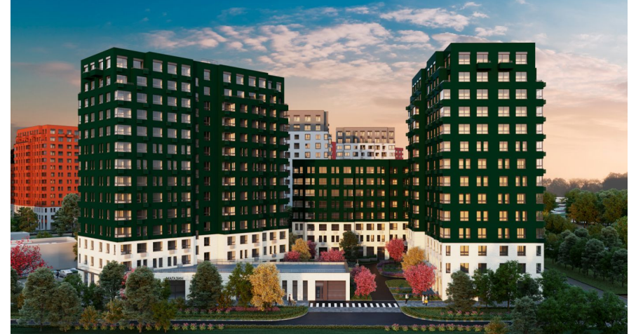
Корпус ЖК: Корпус 9/2/2.2 Квартал сдачи: 2