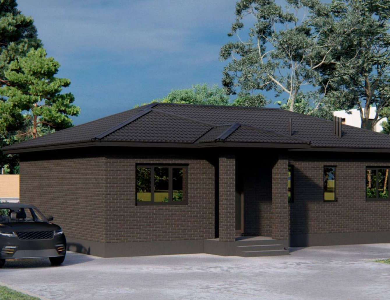
Жилой комплекс: Коттеджный поселок «ВамДом Пятница» Год постройки: 2024