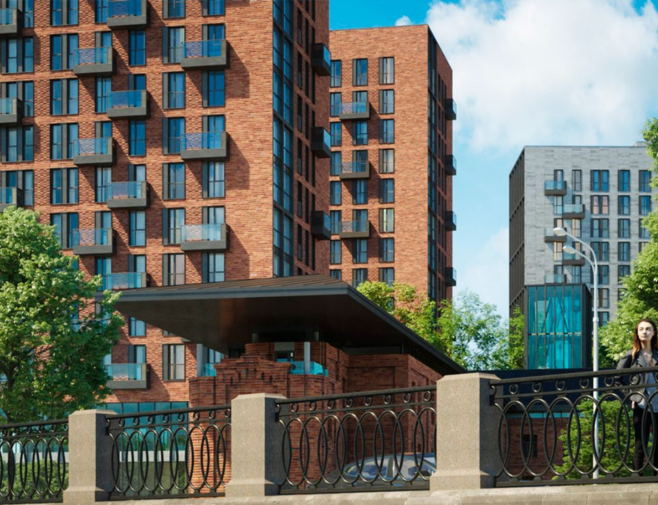
Жилой комплекс: Резиденции композиторов Год постройки: 2022