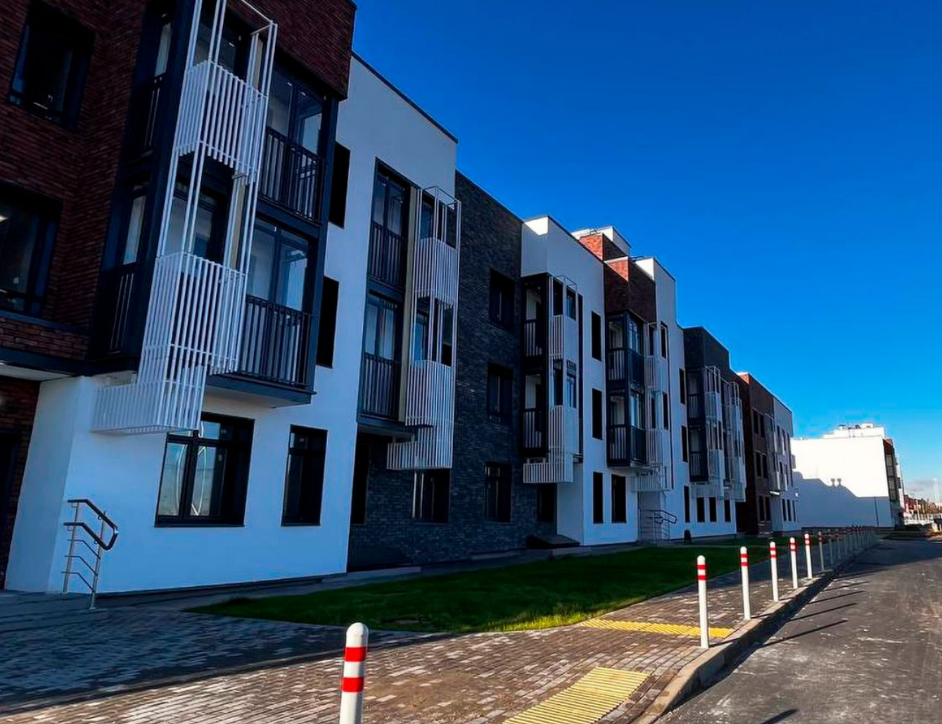
Жилой комплекс: Новая Щербинка Год постройки: 2022