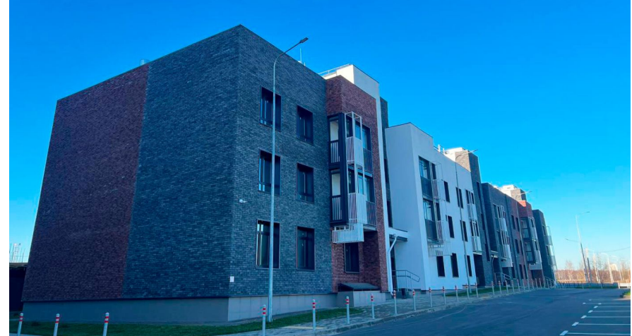
Корпус ЖК: Корпус 13 Квартал сдачи: 4