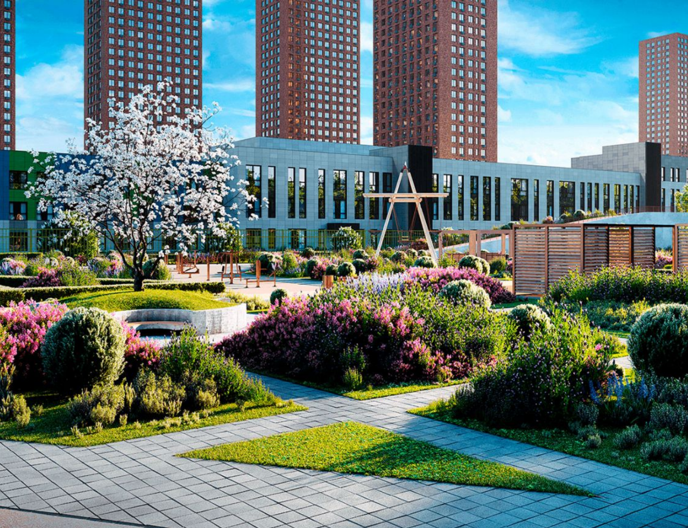
Жилой комплекс: Каштановая роща Год постройки: 2025