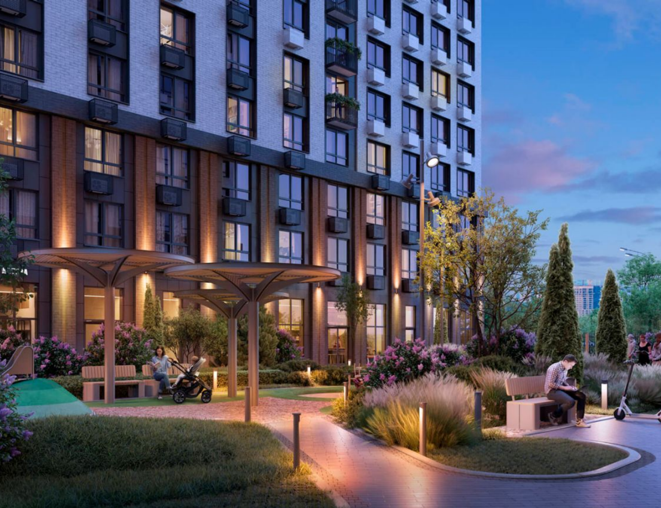
Жилой комплекс: КИТ Год постройки: 2025