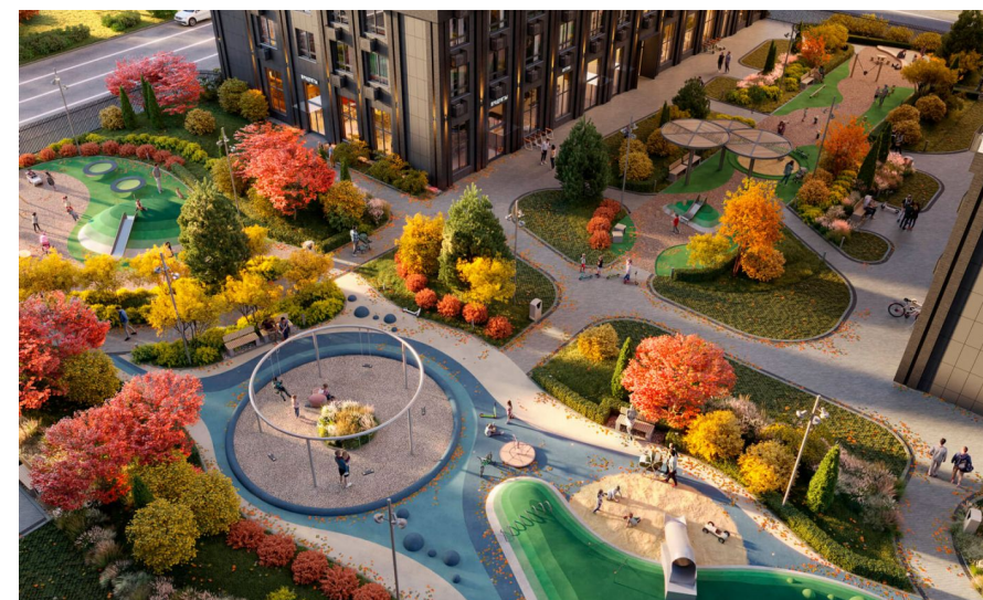
Корпус ЖК: Корпус 3 Квартал сдачи: 4