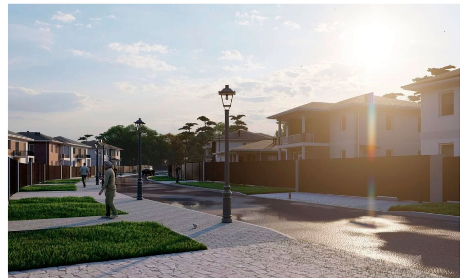
Корпус ЖК: Корпус 95 Квартал сдачи: 2