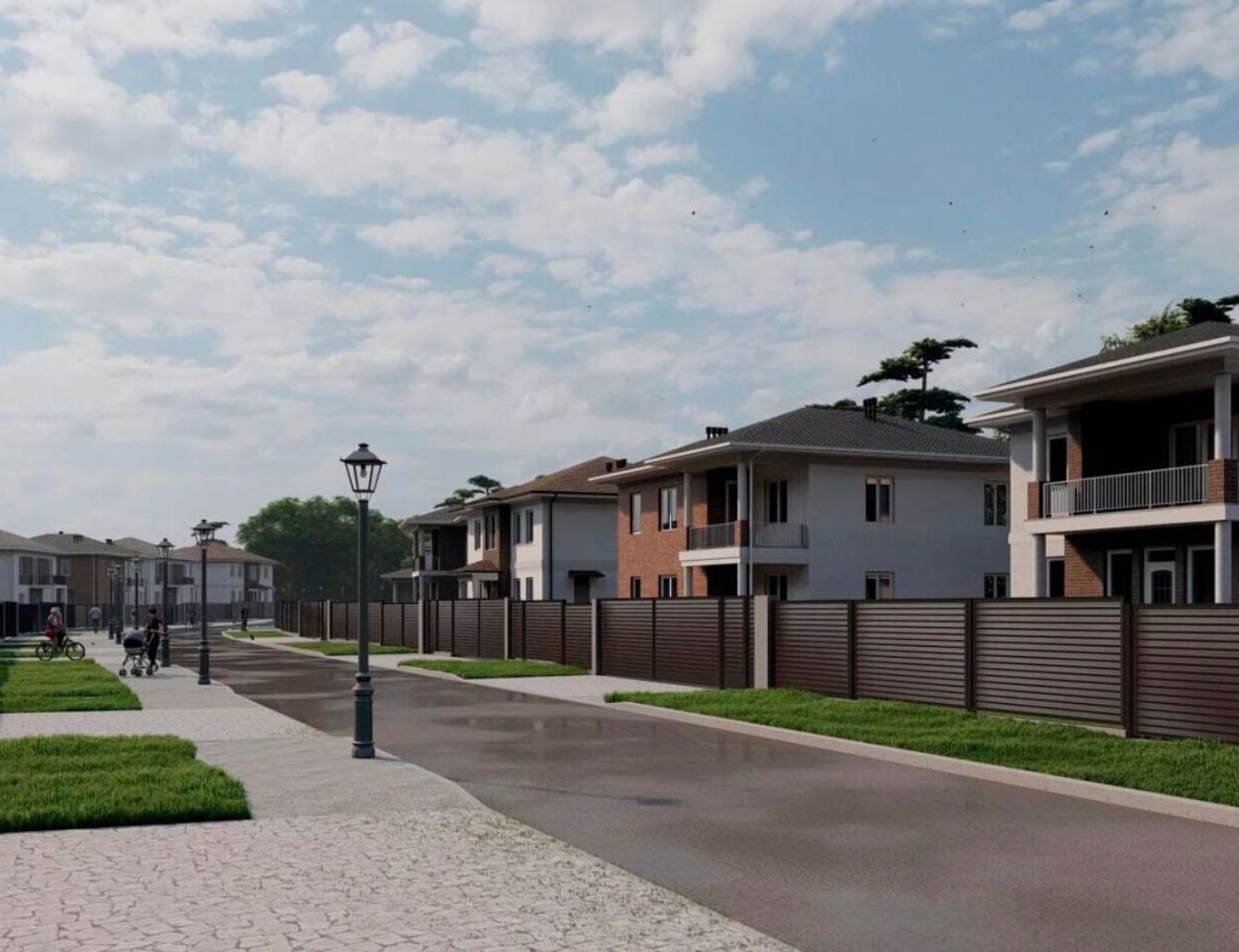
Жилой комплекс: Коттеджный поселок «Подсолнух Парк» Год постройки: 2026