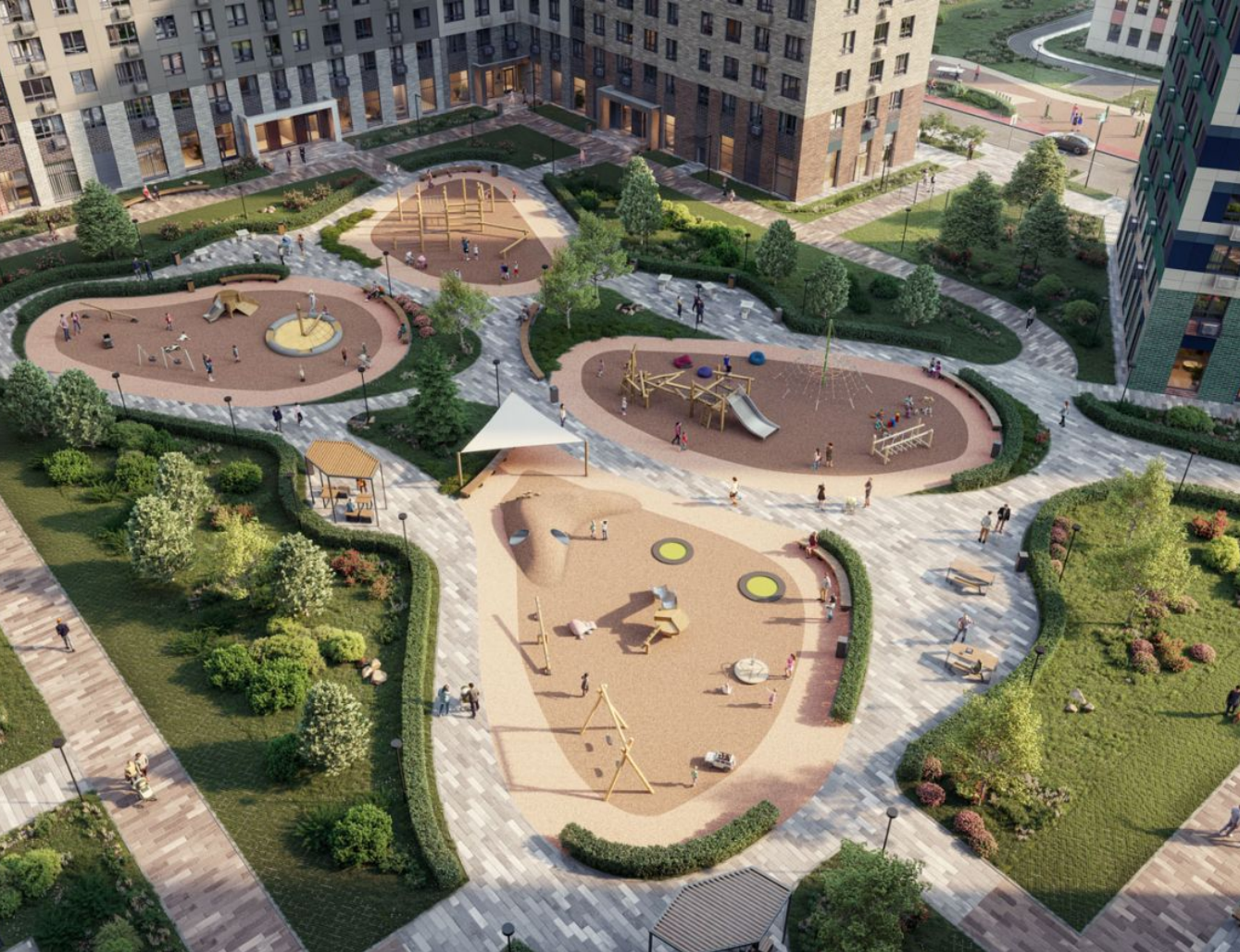
Жилой комплекс: Белый Град Год постройки: 2026