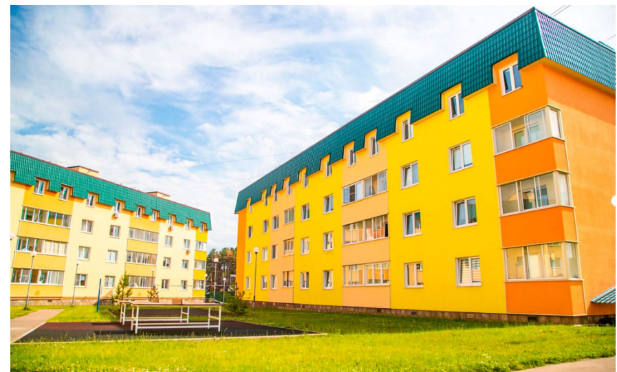
Корпус ЖК: Корпус 83 Квартал сдачи: 2