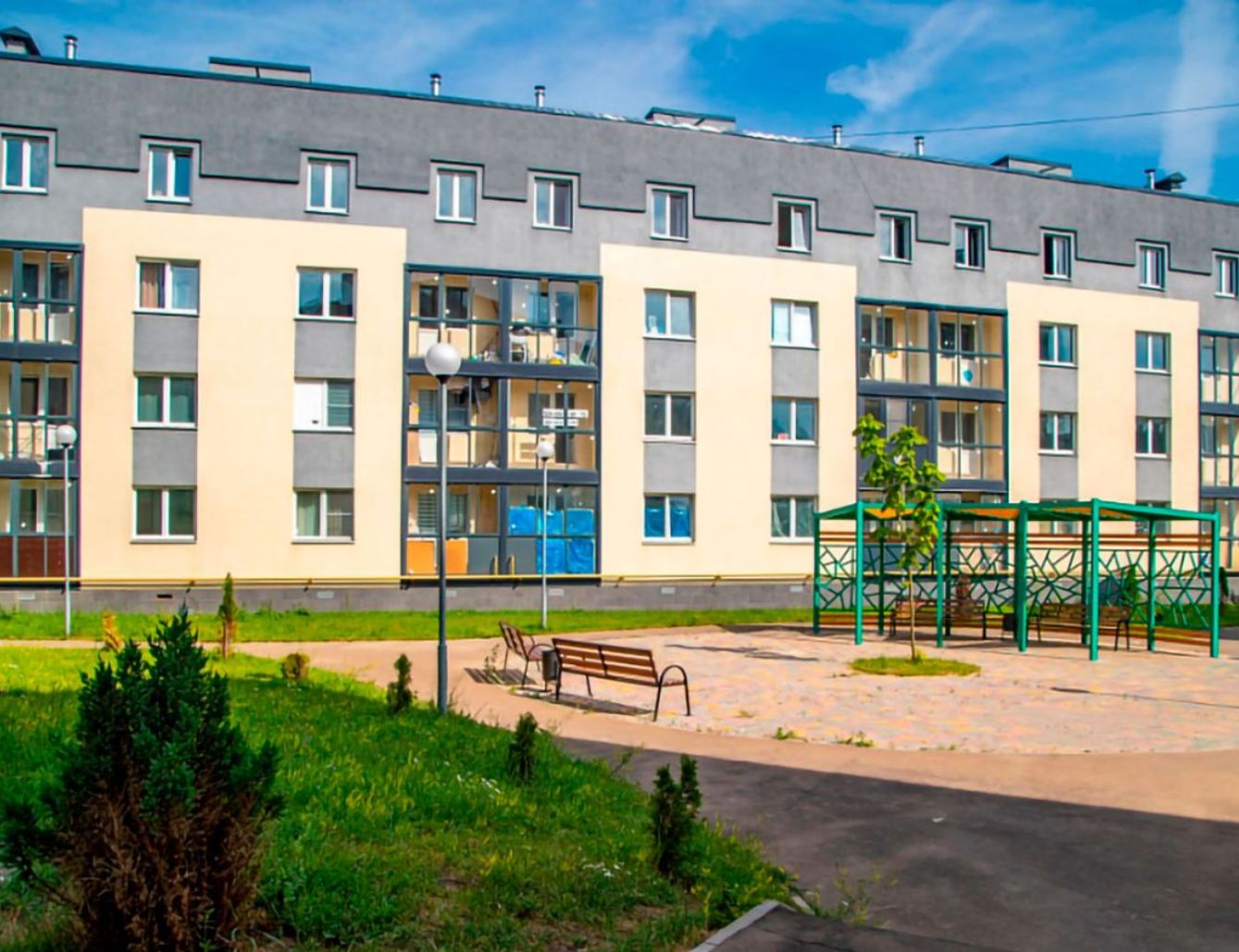
Жилой комплекс: Одинцовские кварталы Год постройки: 2024