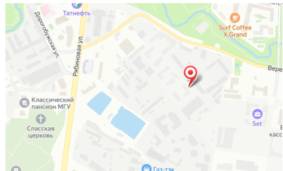
Корпус ЖК: Корпус 4.1 Квартал сдачи: 4