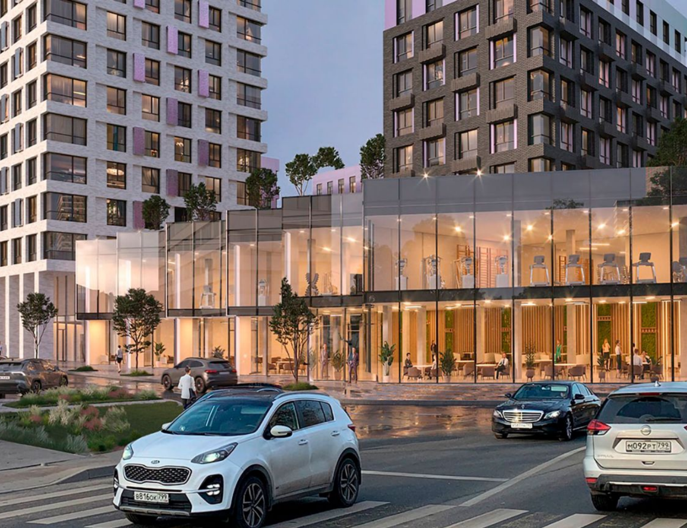
Жилой комплекс: Верейская 41 Год постройки: 2024