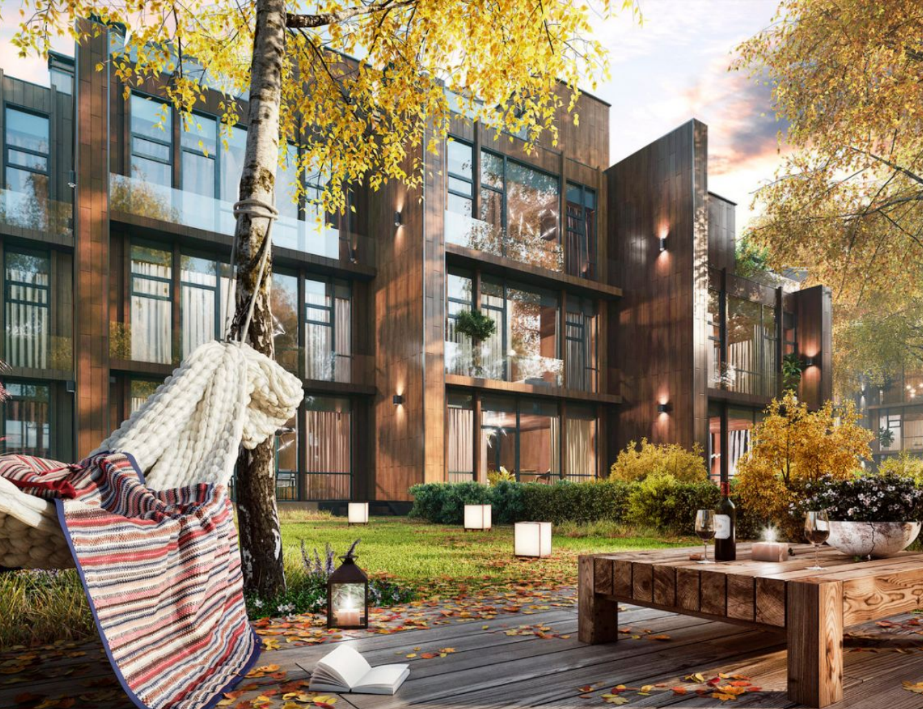
Жилой комплекс: Futuro Park Год постройки: 2022 Тип дома: Монолитный