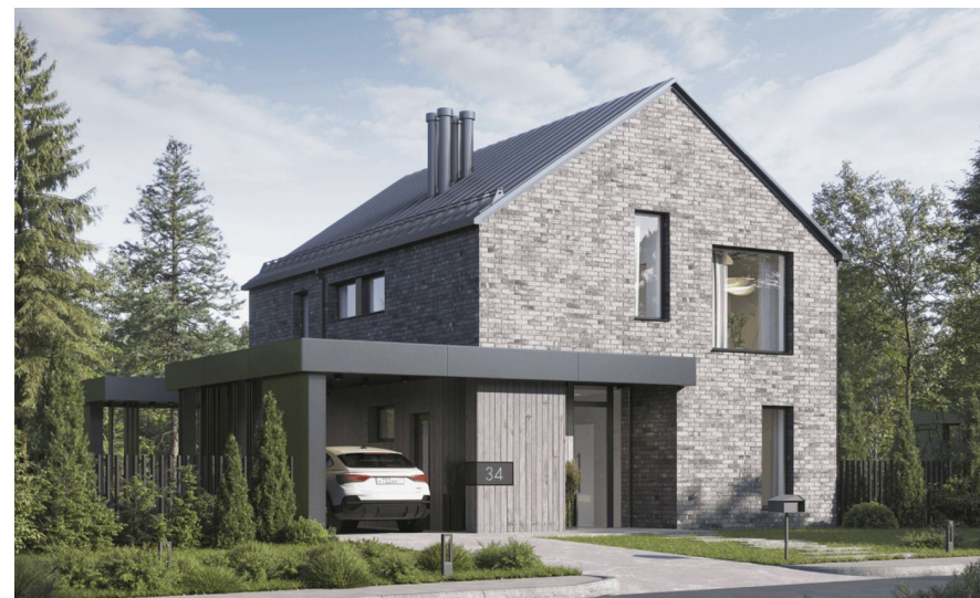
Корпус ЖК: Корпус 28 Квартал сдачи: 1