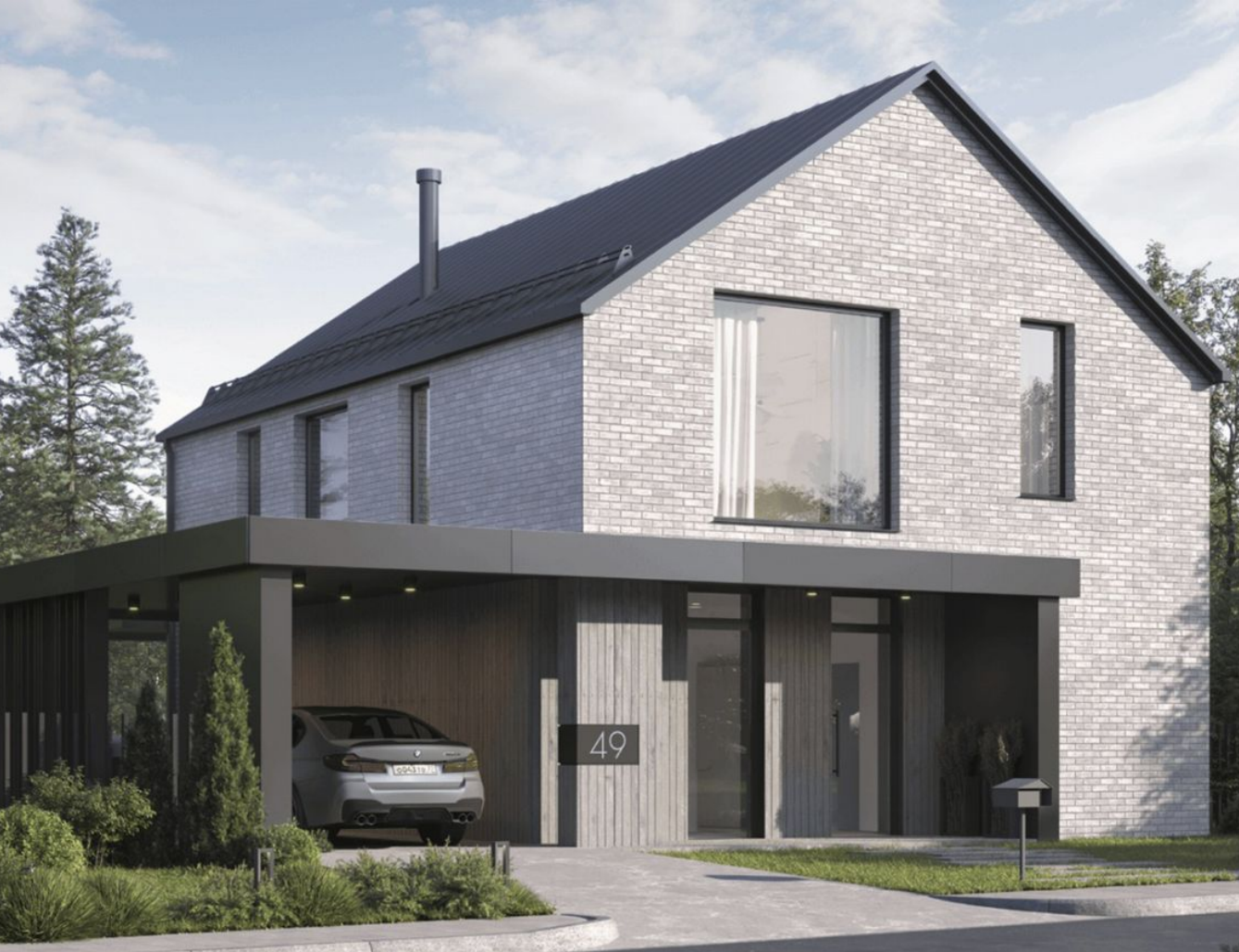
Жилой комплекс: Коттеджный поселок «Сабурово Клуб» Год постройки: 2024