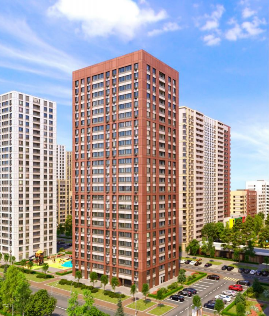
Жилой комплекс: Сиреневый парк Год постройки: 2021