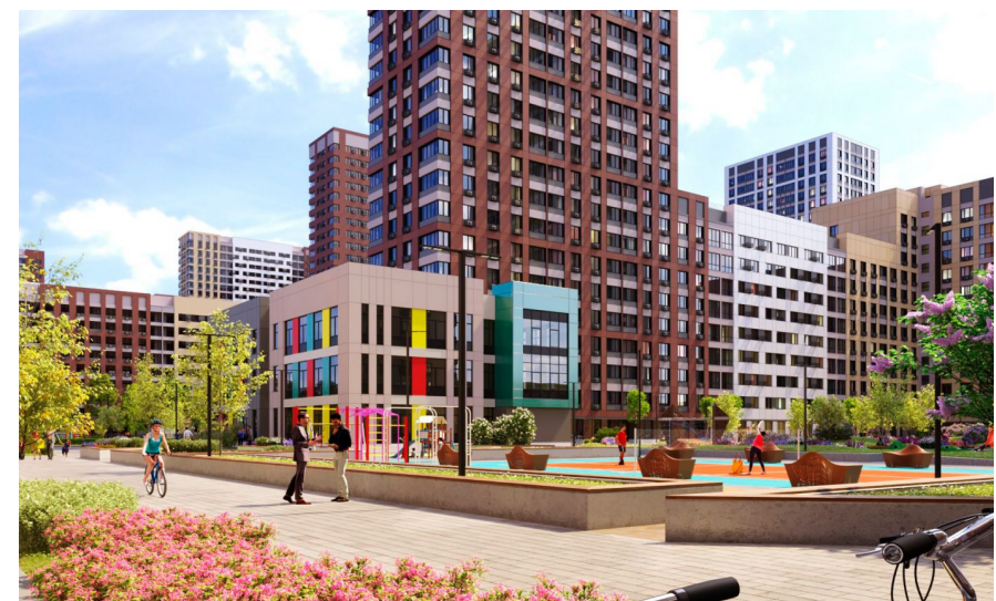
Корпус ЖК: Корпус 7В Квартал сдачи: 3